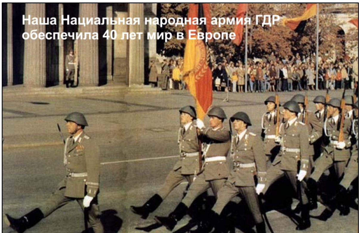
Bild 7: Unsere Nationale Volksarmee sicherte 40 Jahre den Frieden in Europa

Über den „Mauerbau“, über die „Todesopfer an der Berliner Mauer“ und über die „Annexion der DDR durch die BRD“ zu philosophieren ersparen wir uns an dieser Stelle. In unserem Beitrag „Von der DDR in das Jammertal BRD“ finden Sie, verehrte Leserinnen und Leser, auch zu diesen Fragen konkrete Aussagen.